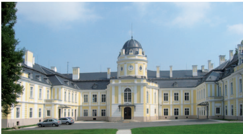
Historia pałacu w Šilheřovicach (Szilerzowicach) trwa od końca XVIII wieku, gdy ród Eichendorffów zlecił w miejscu wcześniejszej renesansowej twierdzy budowę pałacu. Początkowo był to obiekt klasycystyczny, który został przebudowany w stylu pseudobarokowym. Od 1844 do 1945 roku posiadłość należała do rodziny Rothschildów.

A poprzez swoje inwestycje w Ostrawie stał się motorem (dla) rozwoju przemysłu i kształtowania życia społecznego i kulturalnego całego regionu. Do jego zasług należy m.in. budowa Kolei Północnej Cesarza Ferdynanda łączącej Wiedź z Krakowem, a przechodzącej przez Bogumin. Z zupełnie innych powodów słynny jest trzeci z prezentowanych rodów. Eichendorffowie obecni są na obszarze Krainy Górnej Odry od XVII wieku. Byli właścicielami m.in. Krawarza, Szilerzowic i Łubowic. Najbardziej znanym reprezentantem rodu jest Joseph von Eichendorff – śląski/niemiecki prozaik, poeta i dramaturg epoki romantyzmu. Jego poezją, do dziś popularną na całym świecie, zainteresowali się zwłaszcza kompozytorzy. Wiersze poety doczekały się ponad 500 muzycznych opracowań.