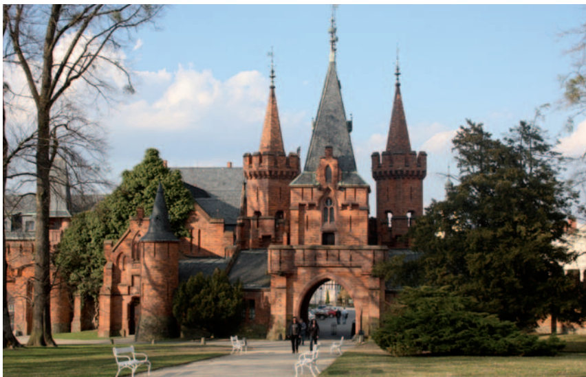
Kompleks pałacowy w Hradcu nad Moravicí (Grodziec nad Morawicą) obejmuje Biały Pałac, neogotycki Czerwony Pałac z główną bramą wejściową (na zdjęciu) oraz park w stylu angielskim. Właścicielami hradeckiej posiadłości było w historii ośmioro książąt i hrabiów Lichnowskich sześciu pokoleń.