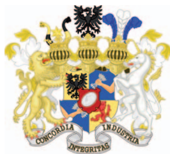
Herb rodziny Rothschildów

A poprzez swoje inwestycje w Ostrawie stał się motorem (dla) rozwoju przemysłu i kształtowania życia społecznego i kulturalnego całego regionu. Do jego zasług należy m.in. budowa Kolei Północnej Cesarza Ferdynanda łączącej Wiedź z Krakowem, a przechodzącej przez Bogumin. Z zupełnie innych powodów słynny jest trzeci z prezentowanych rodów. Eichendorffowie obecni są na obszarze Krainy Górnej Odry od XVII wieku. Byli właścicielami m.in. Krawarza, Szilerzowic i Łubowic. Najbardziej znanym reprezentantem rodu jest Joseph von Eichendorff – śląski/niemiecki prozaik, poeta i dramaturg epoki romantyzmu. Jego poezją, do dziś popularną na całym świecie, zainteresowali się zwłaszcza kompozytorzy. Wiersze poety doczekały się ponad 500 muzycznych opracowań.