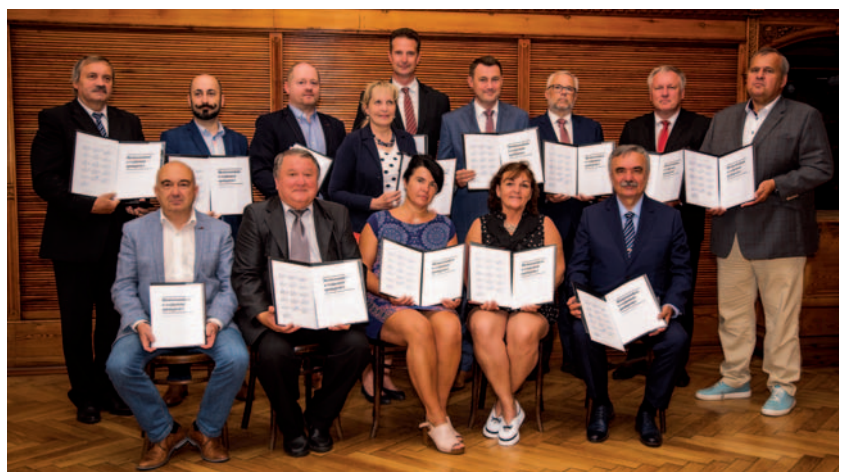
Uroczyste podpisanie memorandum dnia 28 lipca 2021 roku odbyło się symbolicznie na terenie Euroregionu Nisa-Nysa-Neisse, który jako najstarszy Euroregion w Europie Środkowej i Wschodniej w 2021 roku obchodzi swoje 30-lecie.

euroregiony mogą lepiej współpracować przygotowując transgraniczne programy pomocowe na okres 2021-2027 oraz w ramach tych programów przy przygotowaniu funduszy małych projektów, by środki unijne były wykorzystane na faktyczne potrzeby tych regionów i ich mieszkańców. Nie mniej ważnym zadaniem Zrzeszenia jest dążenie do zmniejszenia ciężaru administracyjnego funduszy małych projektów, którymi euroregiony tradycyjnie zarządzają i dzięki którym współfinansowane są przede wszystkim projekty people-to-people. Ambicją Zrzeszenia jest ponadto podniesienie roli euroregionów w rozwoju regionalnym RCz, w szczególności ich ujęcie w ustawie dotyczącej wspierania rozwoju regionalnego, włączenie ich do procesu tworzenia krajowych dokumentów strategicznych w zakresie rozwoju regionalnego oraz włączenie Zrzeszenia do Stałej Konferencji Krajowej, która zapewnia wzajemne powiązania i koordynację partnerów regionalnych w realizacji Porozumienia o partnerstwie i programach współfinansowanych z funduszy europejskich.